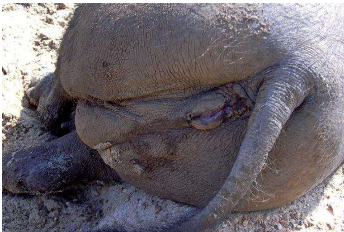
En ganado porcino la leptospirosis se caracteriza por sus efectos sobre la reproducción. Hembra de porcino tras un aborto por leptospirosis.

Esta enfermedad produce pérdidas económicas de forma directa por sus efectos sobre la reproducción en el ganado porcino. Se estima que cerca de un 85 % de las explotaciones testadas a nivel nacional pueden ser positivas a alguna serovariedad patógena de Leptospira .